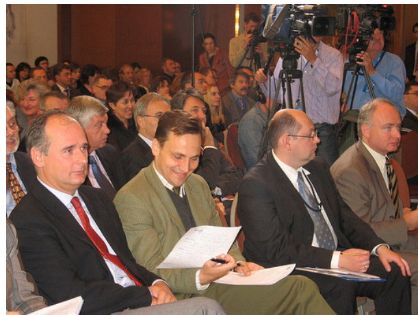
Konferencja "Polska Polityka Zagraniczna na Rozdrożach" Paweł Zalewski, Radek Sikorski